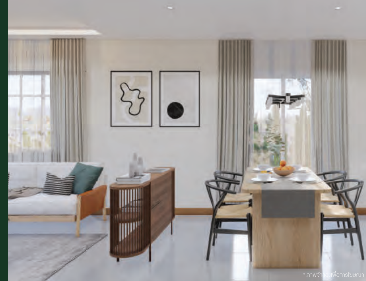
* ภาพห้องเพื่อครอบครัว