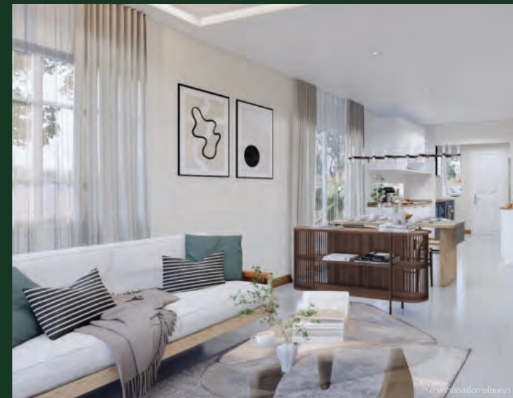
* ภาพห้องเพื่อครอบครัว