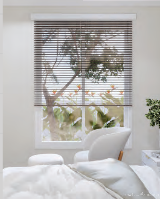
* ภาพห้องเพื่อครอบครัว

“ทุกพื้นที่ถูกดีไซน์” ให้จัดวางเฟอร์นิเจอร์ได้อย่างสวยงามลงตัว รองรับทุกกิจกรรมในครอบครัว ด้วยจำนวนห้องนอนที่หลากหลาย กระจายความสุงได้อย่างไม่จำกัด สามารถปรับเปลี่ยนประโยชน์ใช้สอยได้ตามต้องการ เป็นห้องเรียนออนไลน์ ห้องทำงาน ห้องสำหรับไลฟ์ชายอง ห้องออกกำลังกาย ห้องอเนกประสงค์ และ มีพื้นที่สำหรับทำอาหาร ทั้งครัวใน - ครัวนอก รองรับได้ทุกไลฟ์สไตล์