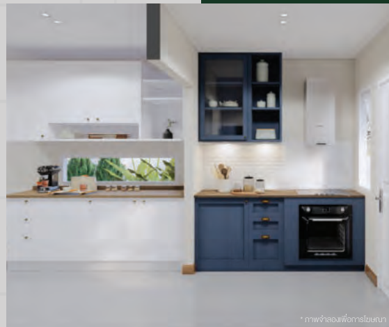
* ภาพห้องเพื่อครอบครัว