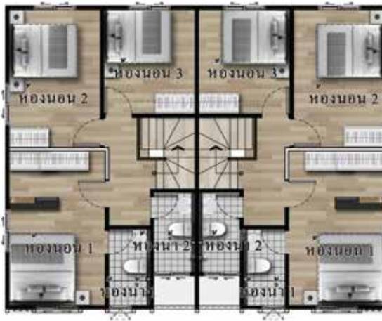
2 nd Floor Plan